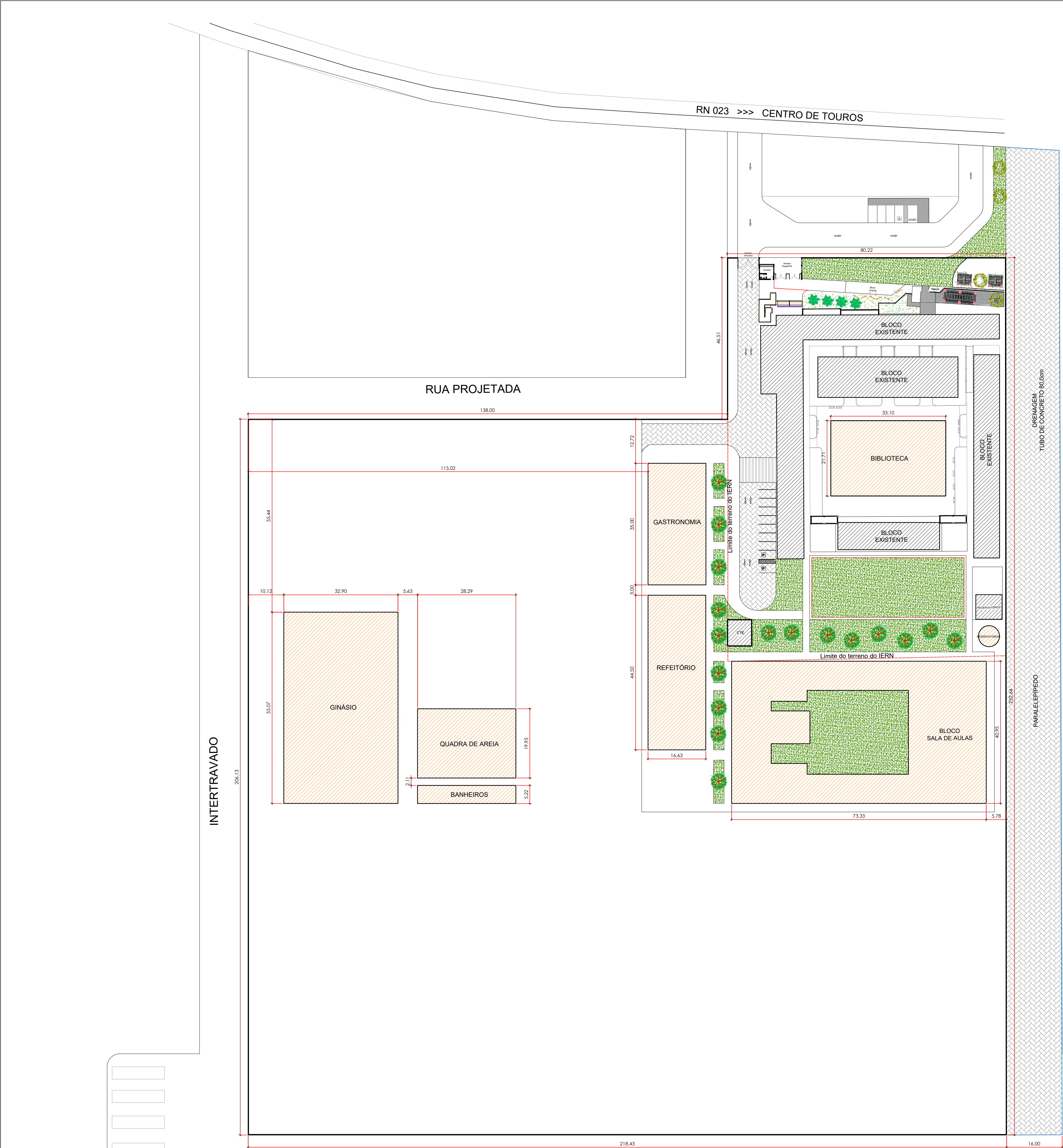
IMPLANTAÇÃO GERAL Escala: 1/750